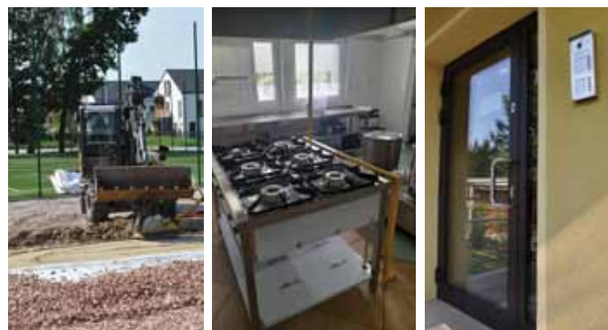
FOT. URZĄD GMINY BRWINÓW (PR)