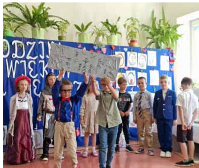
FOT. SP NR 1 W BRWINOWIE