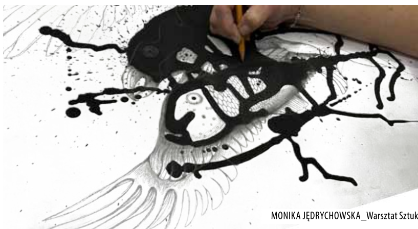
MONIKA JĘDRYCHOWSKA_Warsztat Sztuki

W relacjach fotograficznych zaprezentowane będą również działania najmłodszych grup adeptów oraz zaskakujące wizualne efekty zajęć matematycznych. A wernisaż rozpocznie grupa uzdolnionych tancerzy tango z brwinowskiego słonecznego Przedszkola nr 3.