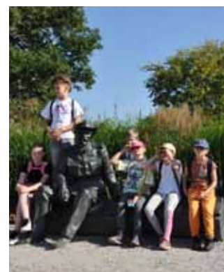
Na zdjęciu: krótka chwila odpoczynku i czas na wspólne pamiątkowe zdjęcie z wyprawy do Brwinowa.

Dzieci zainteresowały się także fotoplastykonem, gdzie prezentowane są zdjęcia z renowacji brwinowskiego pałacu. Był jeszcze krótki spacer do najnowszego muralu w mieście, inspirowanego rysunkiem Artura Grottgera „Kucie kos” oraz do rzeźby Ignacego Kozielskiego. Na obejrzenie innych ciekawych miejsc nie starczyło już czasu, ale uczniowie i nauczycielki zapewniali, że chętnie powrócą do Brwinowa. Wycieczka bardzo im się podobała.