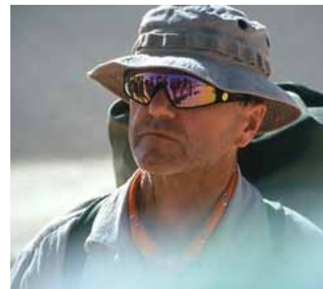
JACEK PAŁKIEWICZ_foto z archiwum autora