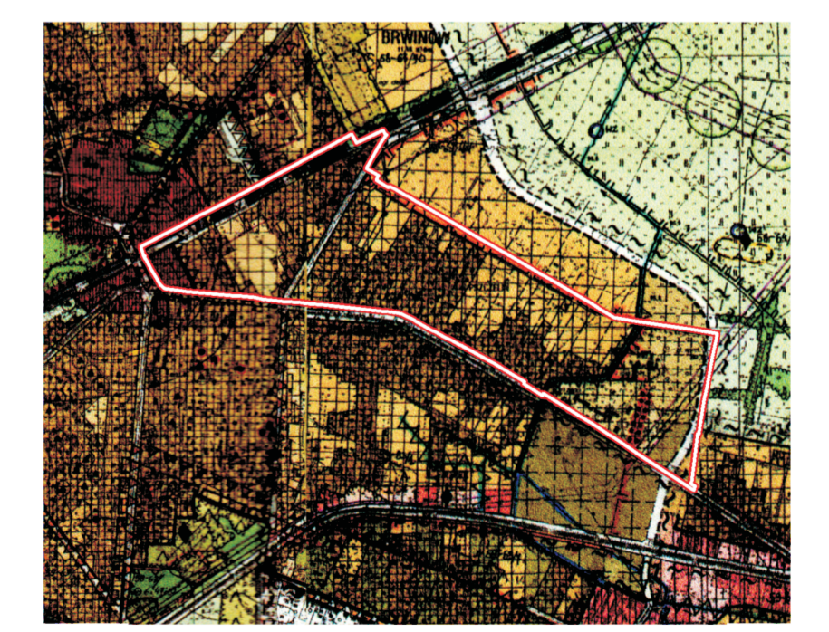
Wzrost ze stadium osiedlenia i kierunku zagospodarowania miasta Brwinowa. Skala: 1:25 000